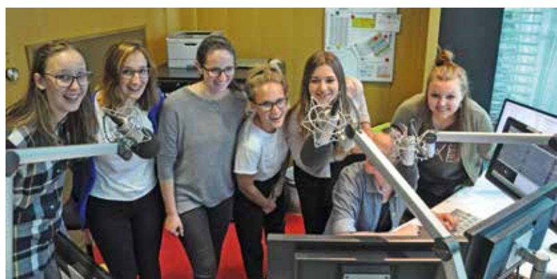
Las sis participantas dal lavuratori «Far medias» dals 20 da matg 2017 en chasa RTR.

Durant ils ultims tschintg onns han 50 persunas fatg diever da questa puschida. E per bleras è il lavuratori stà il punct da partenza per ina carriera schurnalistica tar RTR. Il matg passà ha gi lieu l'emprim lavuratori da quest onn. E per l'emprim