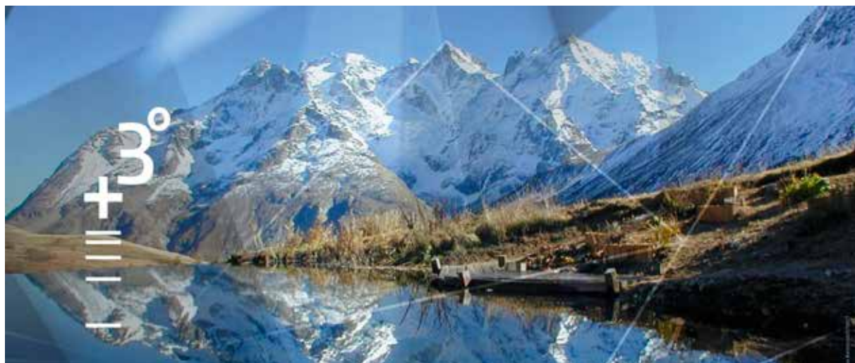
Tge capita en Svizra, sche la temperatura s'augmenta per trais grads?

Flavio Bundi cumenza sia plazza il 1. da november 2017. Gian Ramming, schefredactor dapi il 2009, resta commember da la direcziun RTR e surpiglia ed installescha la nova partiziun «svilup».